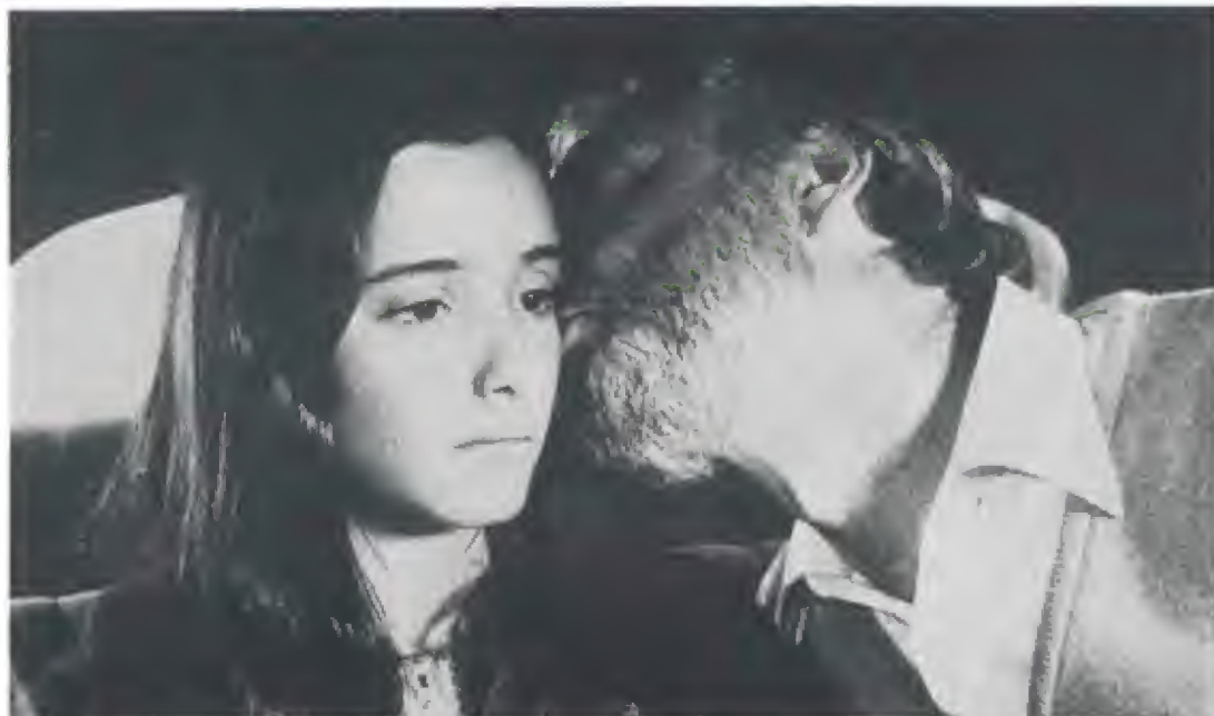
Ana Torrent - Héctor Alterio